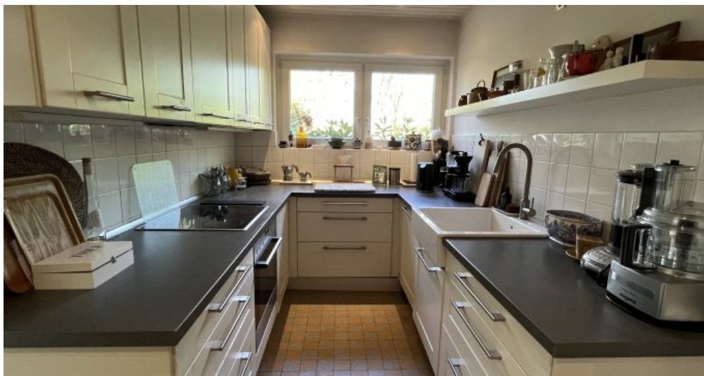
Gut möblierbare Küche