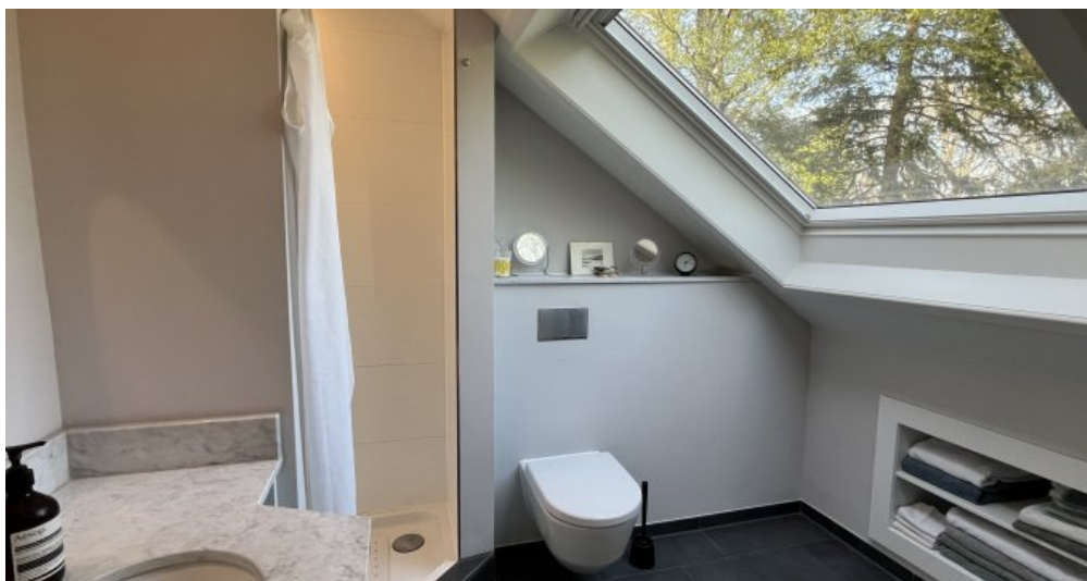
Duschbad mit Aussicht