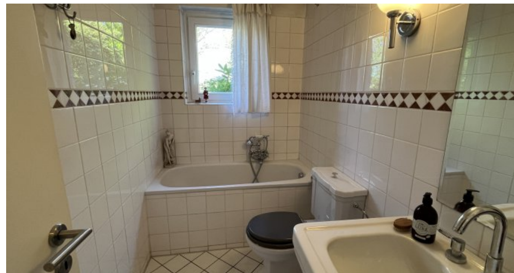
Vollbad im Erdgeschoss