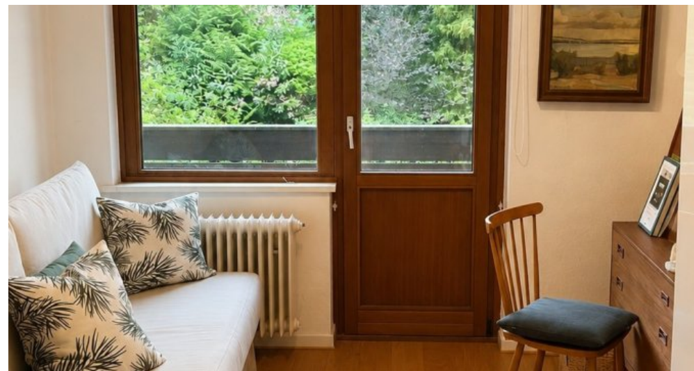
mit Zugang zum Balkon